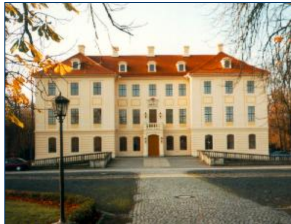
Palais Zabeltitz inmitten der reizvollen Röderaue

Die Gemeinden Zeithain (7.000 Einwohner) und Glaubitz (2.000 Einwohner) liegen beide direkt an der Elbe. Zu den touristischen Highlights der Umgebung zählen die Elbweindörfer um Diesbar-Seußlitz, der Elberadweg sowie die Rad- und Wandergebiete der Gohrisch-Heide, der Röderaue und des Elbe-Floßkanales. In der nur 8 km entfernten Erdgas Arena Riesa sind regelmäßig bedeutende Kultur- und Sportevents zu erleben. Auch die mittelalterlichen Städte Großenhain, Strehla und Meißen sind schnell zu erreichen.